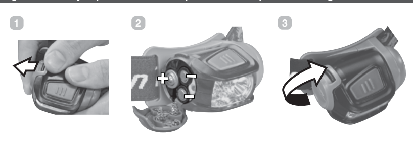
Figure 2 – Battery Replacement Remplacement des piles Einlegen der Batterien

will be in darkness for about one second as the light sees this press as a signal to turn the light off and switch to the other light source simultaneously.